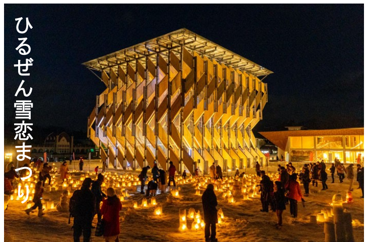
ひるぜん雪恋まつり